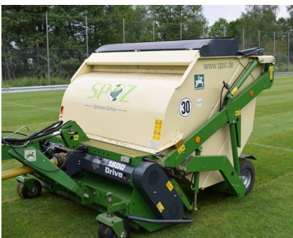
→ Die Grasnarbe wird leicht angeritzt

Die Aufnahme des anfallenden Materials erfolgt von uns.