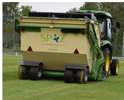
→ Der starke Rasenfilz wird entfernt und der Boden belüftet