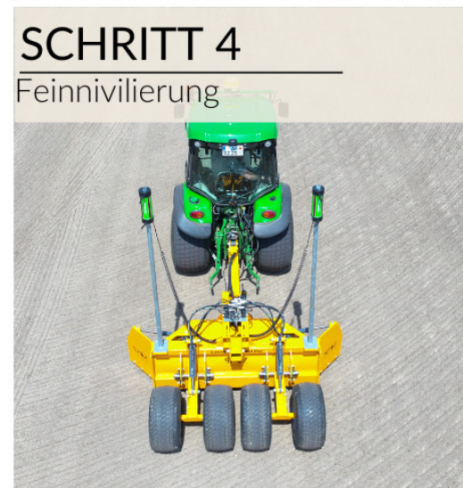
SCHRITT 4 Feinnivellierung