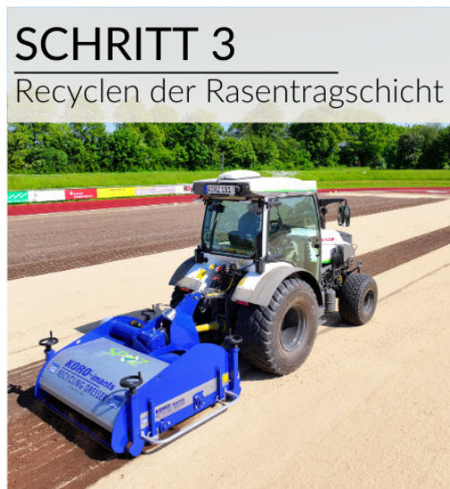
SCHRITT 3 Recyclen der Rasentragschicht