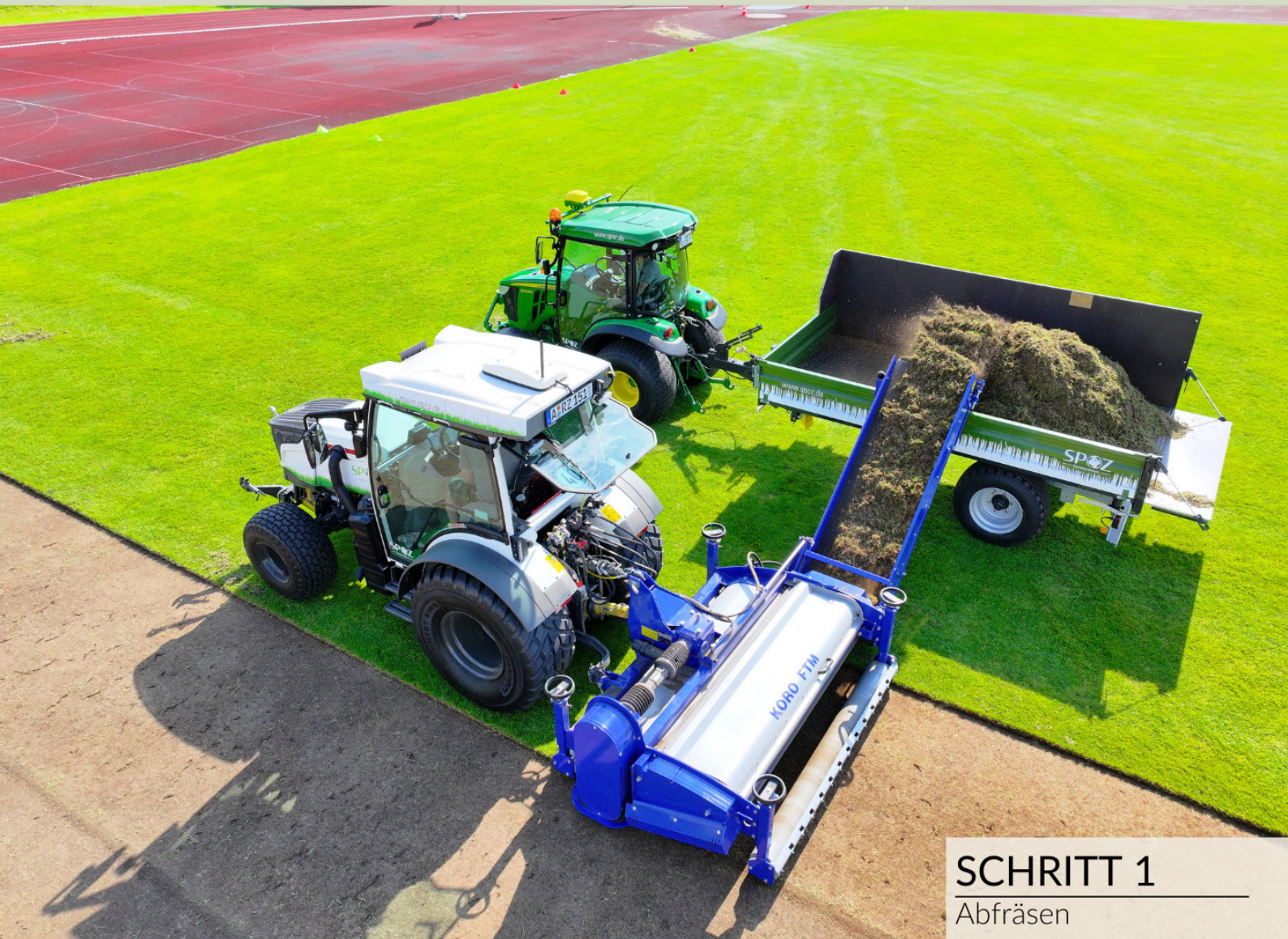
SCHRITT 1 Abfräsen

Wir wünschen all unseren Kunden viel Spaß und Erfolg mit ihrem neuen Rasen.