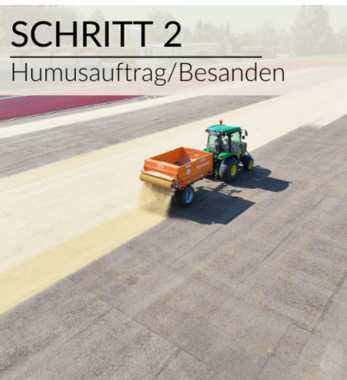
SCHRITT 2 Humusauftrag/Besanden